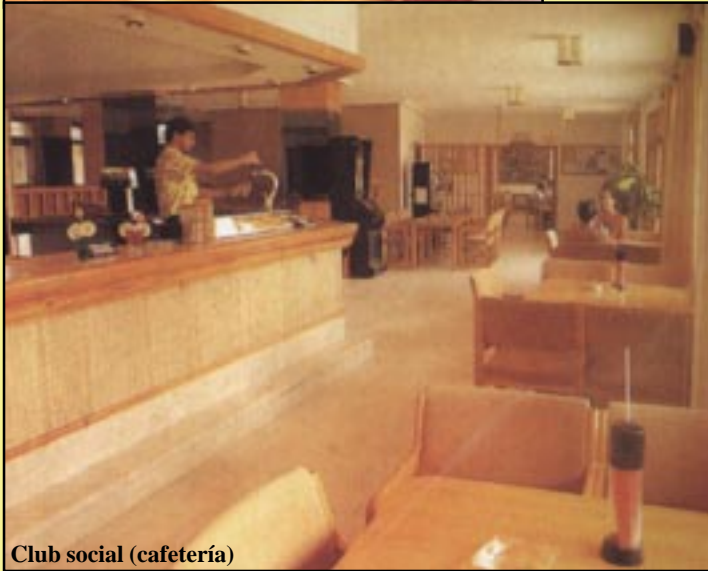
Club social (cafetería)