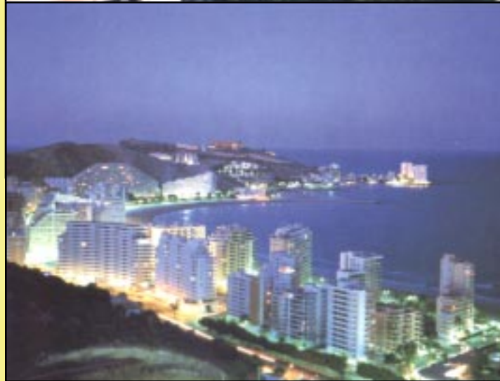
BAHÍA DE LOS NARANJOS (PLAYA DEL RACÓ)